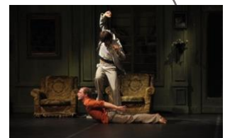
Le Salon (2004)

La principale marque de fabrique de Peeping Tom est une esthétique hyperréaliste, soutenue par une scénographie concrète : un jardin, un salon et une cave dans la première trilogie Le Jardin (2002), Le Salon (2004) et Le Sous-Sol (2007), deux caravanes résidentielles dans un paysage enneigé dans 32 rue Vandenbranden (2009), un théâtre brûlé dans À Louer (2011) et une maison de retraite dans Vader (2014).