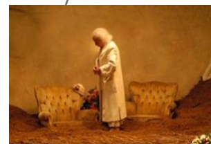
Le Sous Sol (2007)

Les chorégraphes y créent un univers instable qui défie la logique du temps et de l'espace. L'isolement y mène vers un monde onirique de cauchemars, de peurs et de désirs dans lequel les créateurs mettent habilement en lumière la part sombre de l'individu ou d'une communauté. Ils explorent un langage extrême de la scène et du mouvement – jamais gratuit – avec toujours la condition humaine comme principale source d'inspiration et résultat.