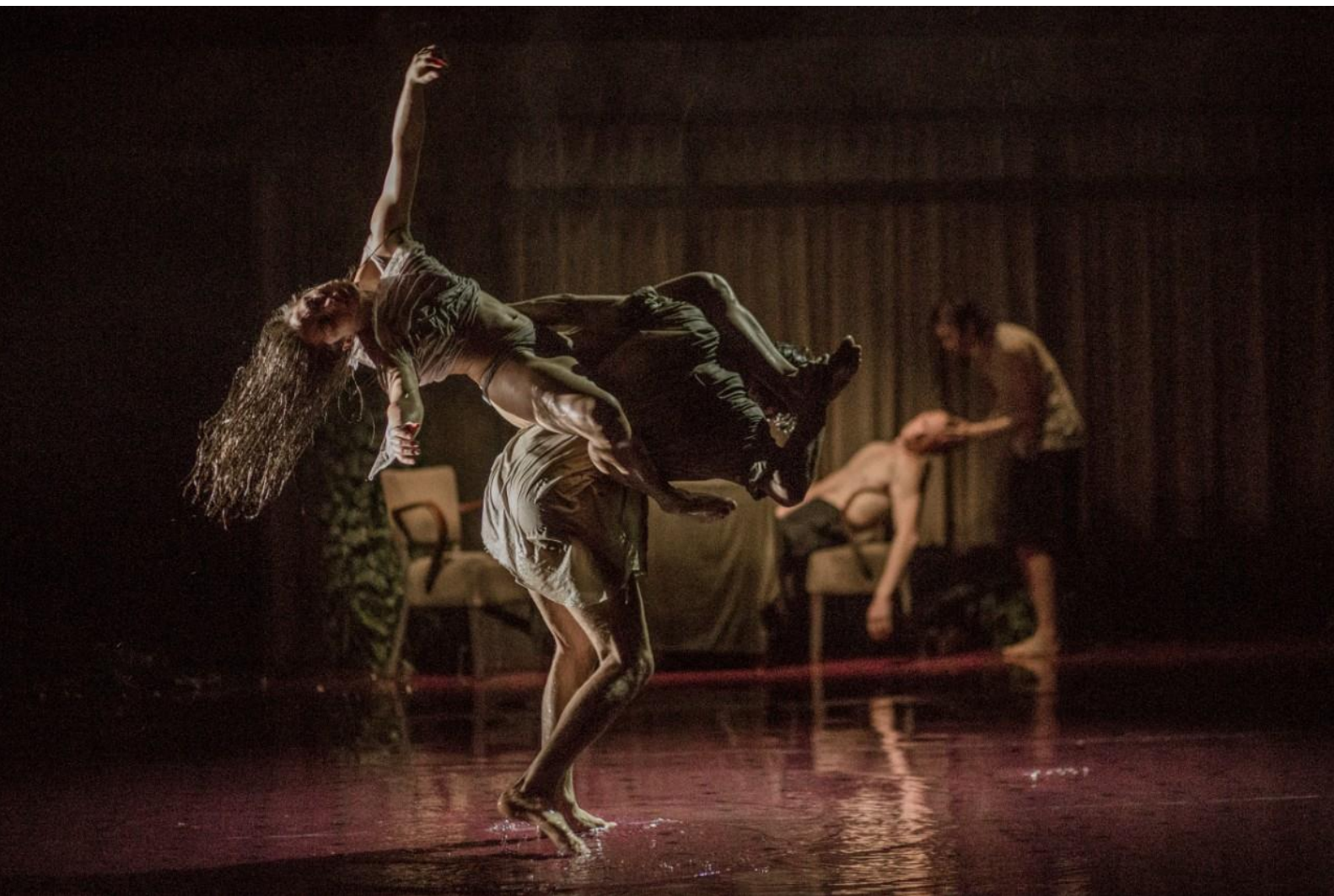
TRIPTYCH © Virginia Rota, Peeping Tom