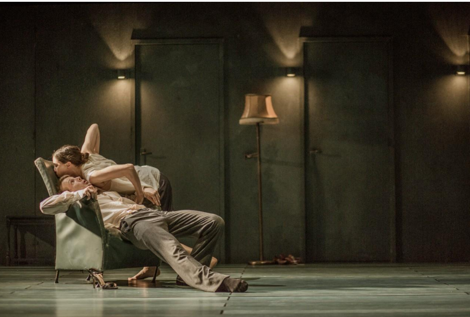
TRIPTYCH © Virginia Rota, Peeping Tom