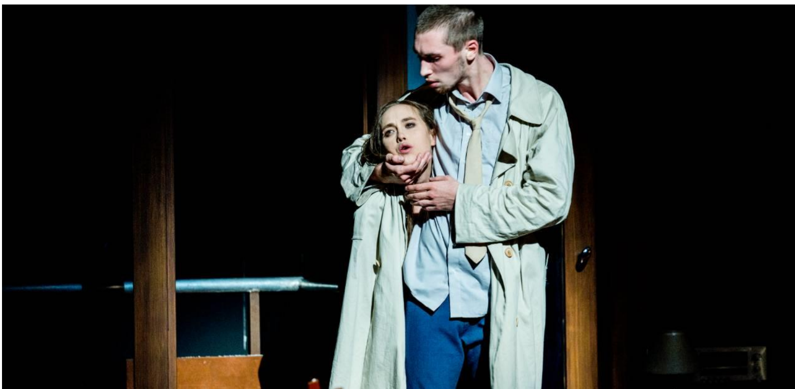
TRIPTYCH © Maarten Vanden Abeele, Peeping Tom