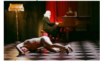
A Louer (2011)

En 2015, Gabriela Carrizo a créé The Land , une production avec les acteurs du Residenztheater (Munich, DE) en collaboration avec Peeping Tom, dont la première mondiale a eu lieu le 8 mai dans le Cuvilliéstheater (Munich, DE) en ouverture du festival DANCE 2015. Le 1 er octobre 2015, Franck Chartier a présenté The lost room , une nouvelle pièce courte avec les danseurs de la compagnie Nederlands Dans Theater, une suite à The missing door (Gabriela Carrizo, 2013).