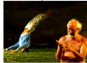
Le Jardin (2002)