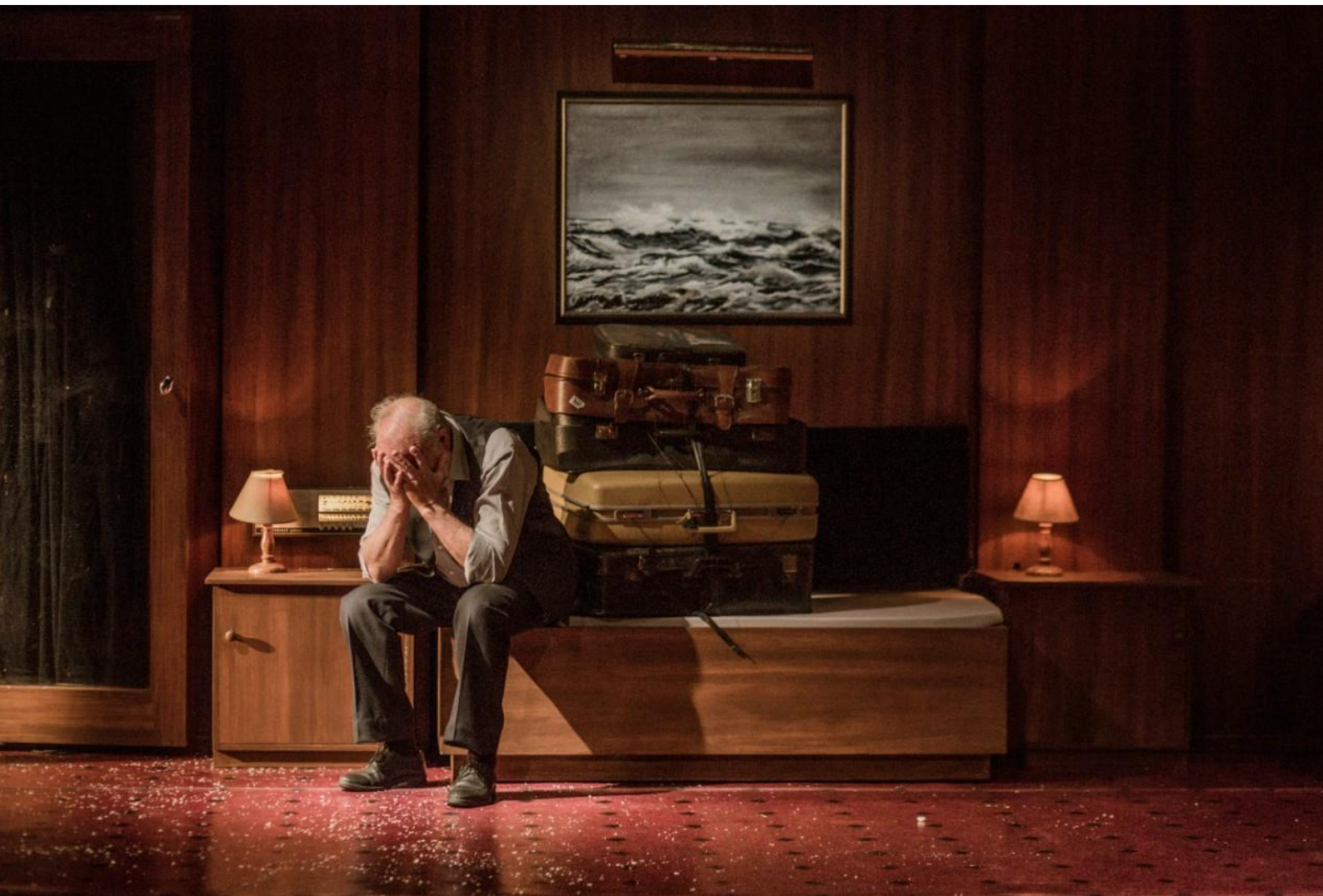
TRIPTYCH © Virginia Rota, Peeping Tom