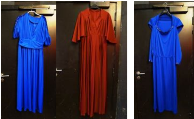
Koude Machinewas, geen droogkast