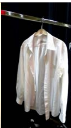
wit hemd 40°