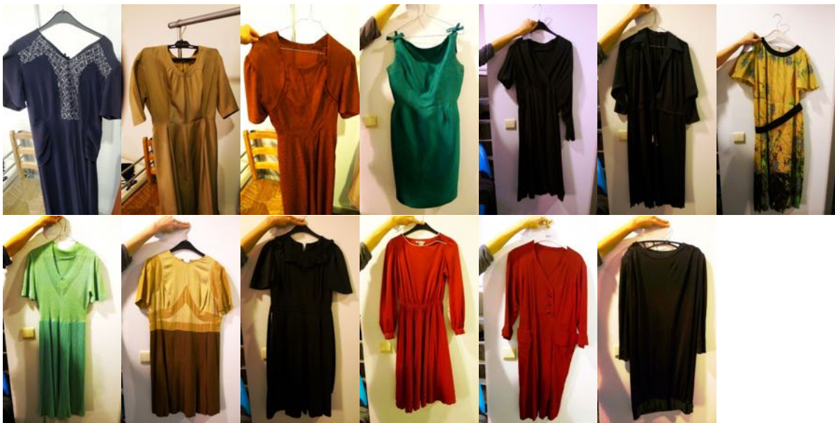
Koude was, geen droogkast