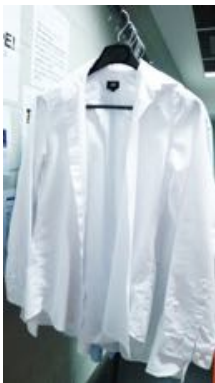
wit hemd 60°