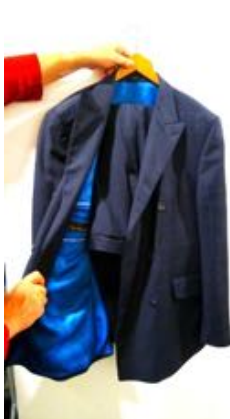
Blauw Kostuum Droogkuis