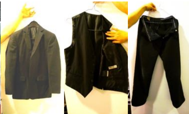
3-delig zwart kostuum 'Angelo Litrico' Droogkuis