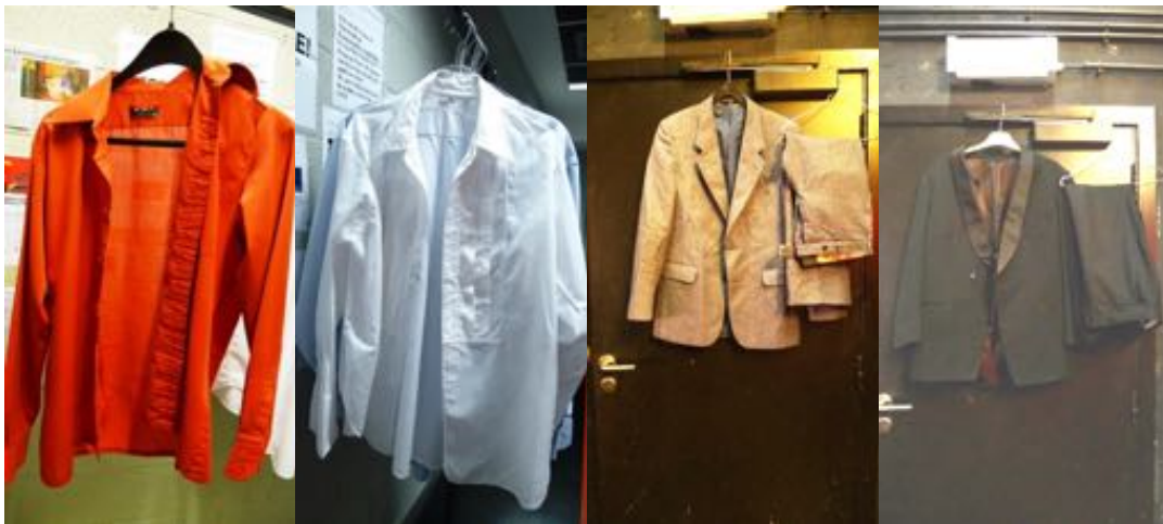
Oranje hemd 40°