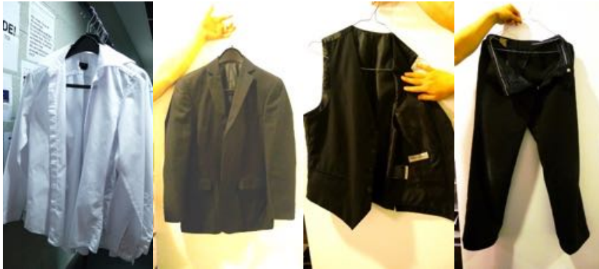
Wit Hemd 60°