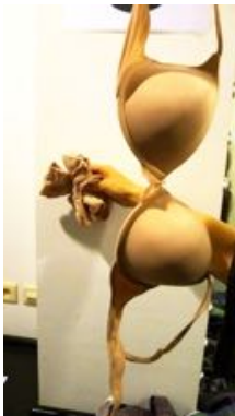
Beha huidskleur en kousen 60°

+ Lange zwarte doorzichtige vest (niet strijken)