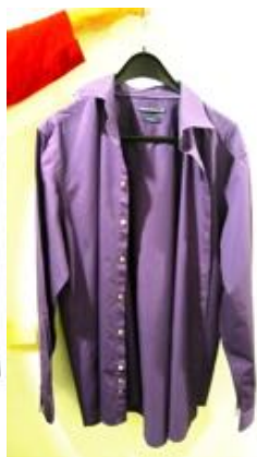
purper hemd 40°