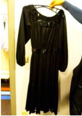
Zwart kleed met borduur + witte beha + zwarte kousen Koud machinewas, geen droogkast 60°