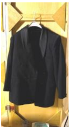
Zwarte Smoking Droogkuis