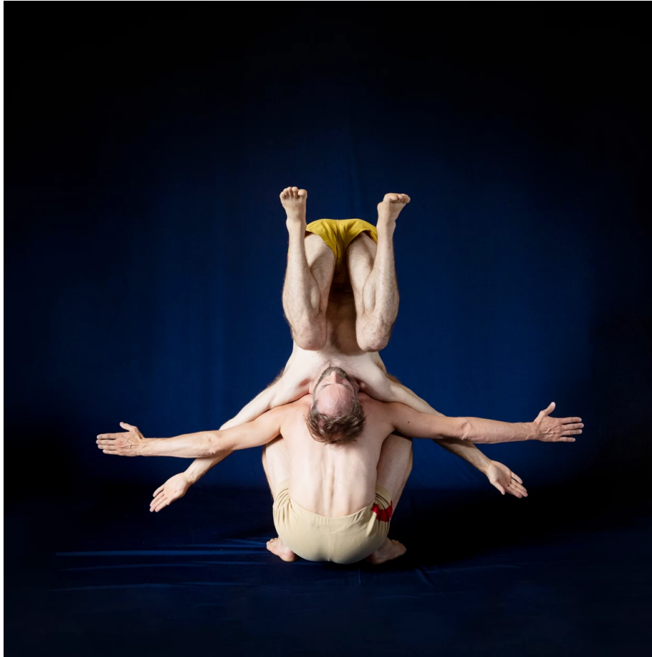
De Rio.

Vantournhout's lichaam leunt met gespreide armen op zijn kop op de schouderbladen van een gehurkte Guérin, eveneens met armen in spreidstand.