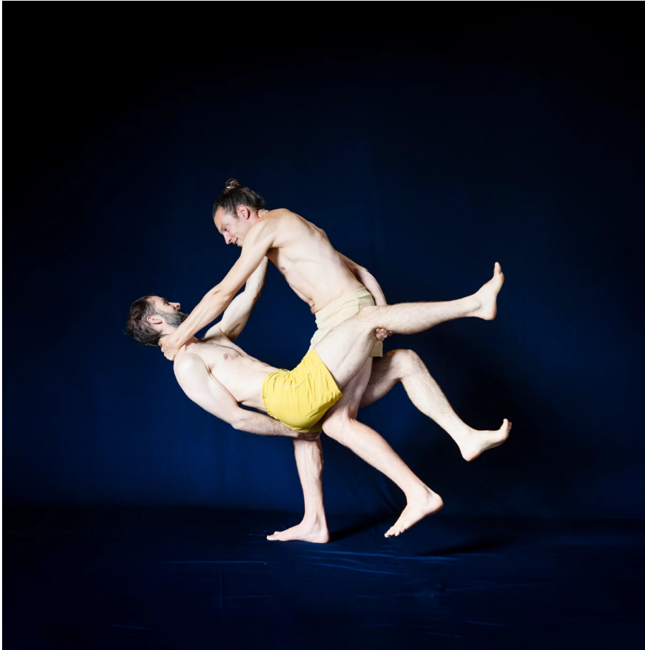
De centauro. Beeld Pauline Niks

Guérin draagt een horizontaal 'zwevende' Vantournhout (met baard) op de knie van één been.