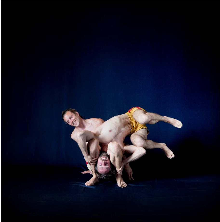
De vlag.

Vantournhout hangt schuin, op zijn kop, met horizontaal zwevende benen in de schoot van een hurkende Guérin.