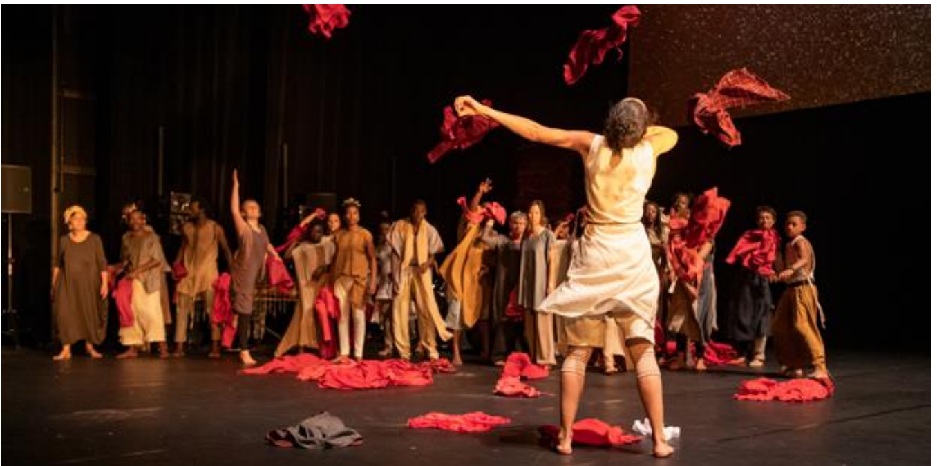
© Philippe Magoni – Kirina (2018)