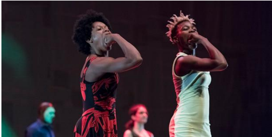
© Sophie Garcia – Kalakuta Republik (2017)