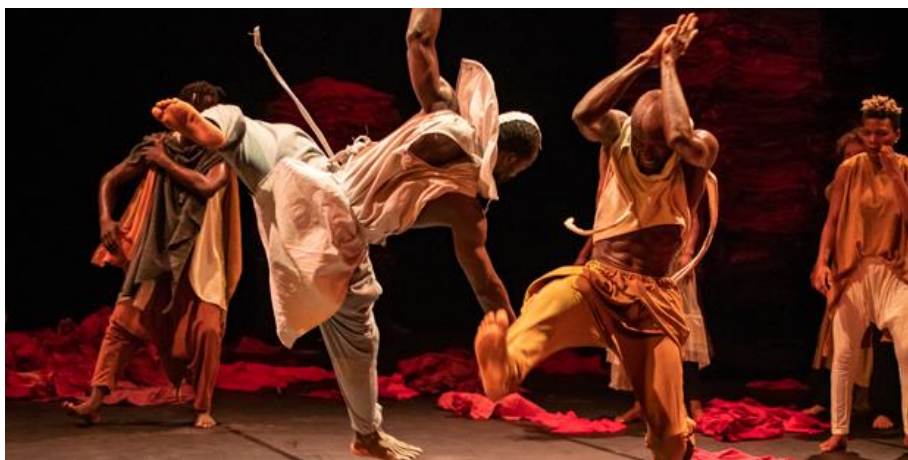
Kirina (2018)

Faso Danse Théâtre Gabrielle Petitstraat 4/9 1080 Brussel - België