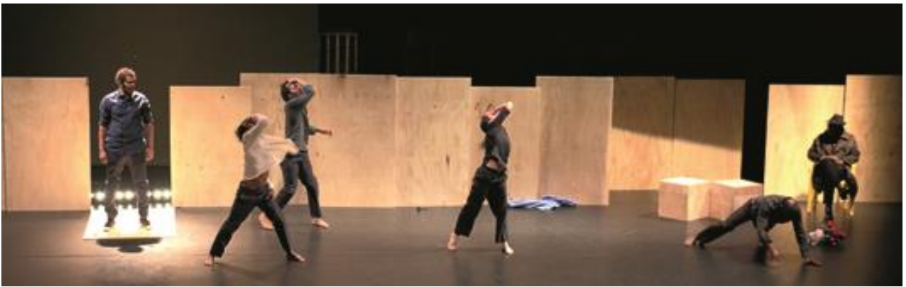
© Pierre Van Eechaute – Nuit Blanche à Ouagadougou (2014)