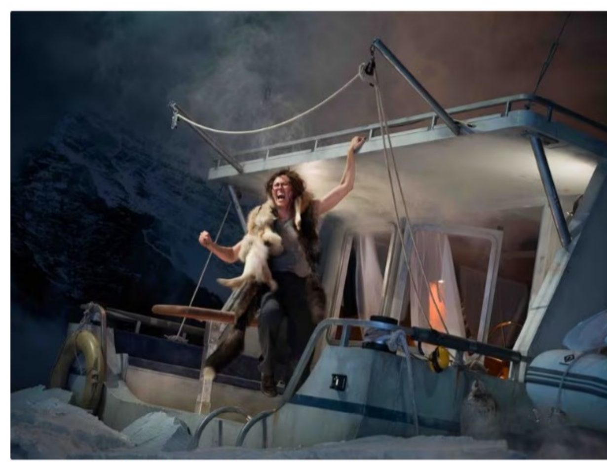
Peeping Tom: S 62° 58'; W 60° 39'