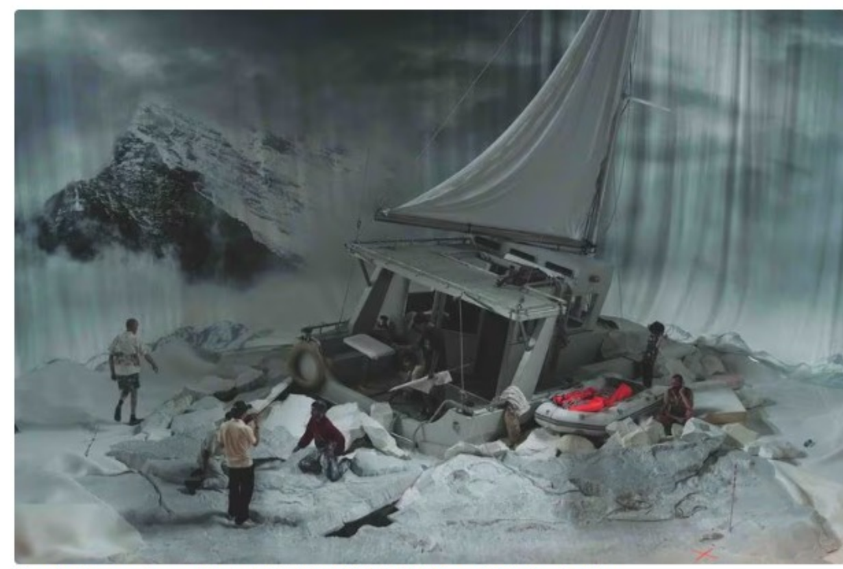
Peeping Tom: scénographie de S 62° 58', W 60° 39'